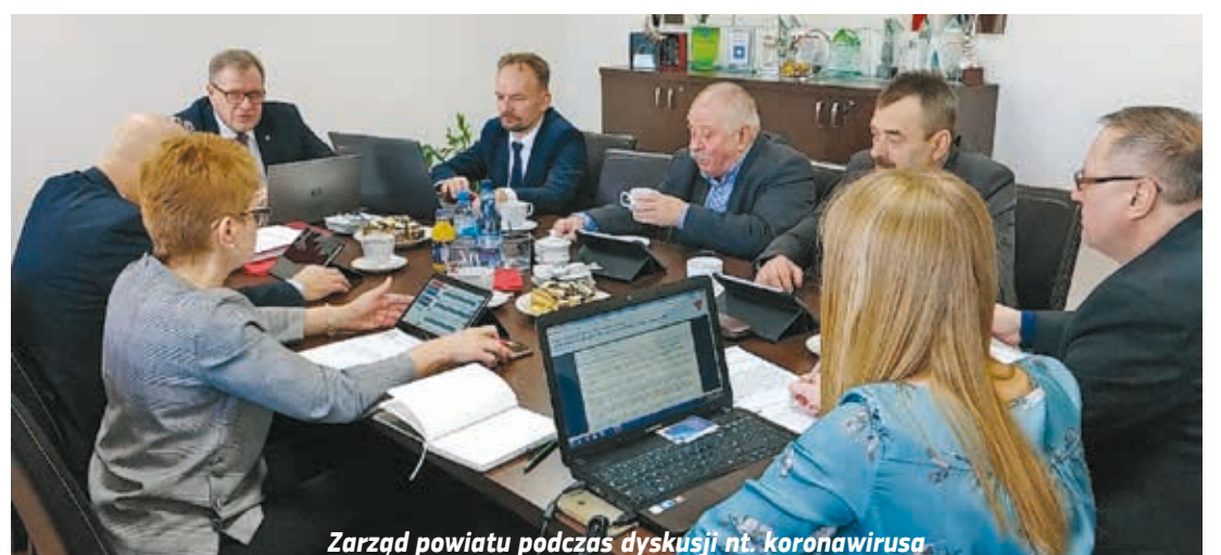
Zarząd powiatu podczas dyskusji nt. koronawirusa