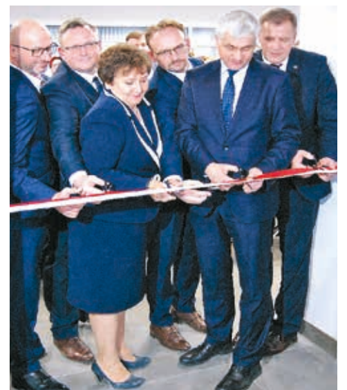
Symboliczne przecięcie wstęgi